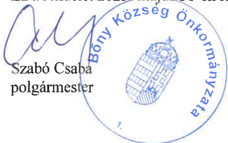
Szabó Csaba polgármester

Ez a rendelet 2023. május 31-én lép hatályba.